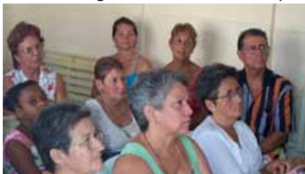
Congregación La Vigia

muchos hermanos, nombrados unos y anónimos otros que desean hacer de la Iglesia de Cristo un cuerpo espiritual dirigido por el propio Jesús y expresar por sus conductas diarias del diario vivir, una sensación de credibilidad y seguridad para ser seguidos por aquellos a los que se le predica el Evangelio.