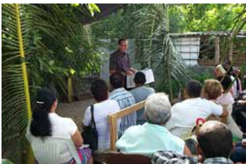
Culto en la Yamagua