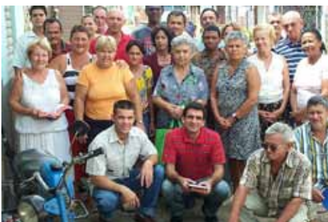
Congregación Jobo Gordo

Quiero expresar la enorme gratitud que siento para con Dios y para con estos hermanos y a la vez amigos, a los que me encuentro unido, no sólo por la Fe en Cristo, sino también en el trabajo en equipo que realizamos para hacer de la Iglesia en el Centro de Cuba, una Iglesia del Nuevo Testamento digna de nuestro Salvador.