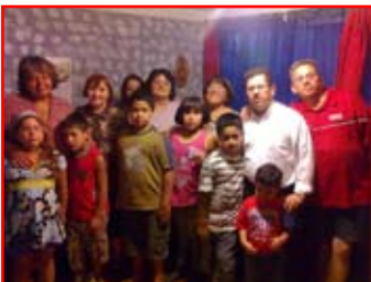
oraciones en favor de ésta nueva obra. BAUTISMOS EN NOGALES. Dios sigue tratando de